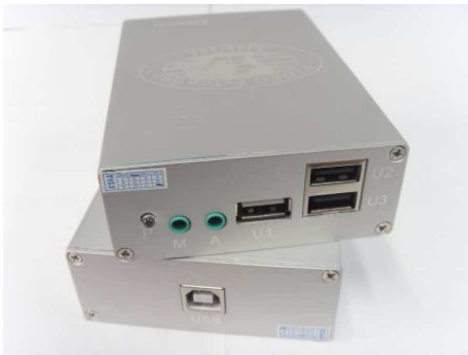
Рис.1 Внешний вид TA-U1/2+RA-U3/2