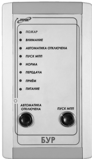
Рис. 1. Внешний вид «БУР»

4.2. Внешний вид Изделия приведён на рис. 1, а внешний вид кронштейна крепления, с помощью которого изделие устанавливается на стене помещения – на рис. 2.