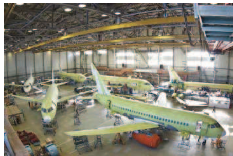
Авиа- и ракетостроение