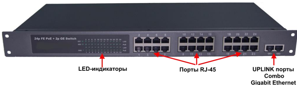
Рис.2 Коммутатор SW-62422/B (SW-62422/B(400W)), вид спереди