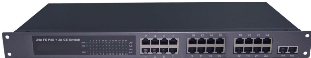
Рис.1 Коммутатор SW-62422/B (SW-62422/B(400W))