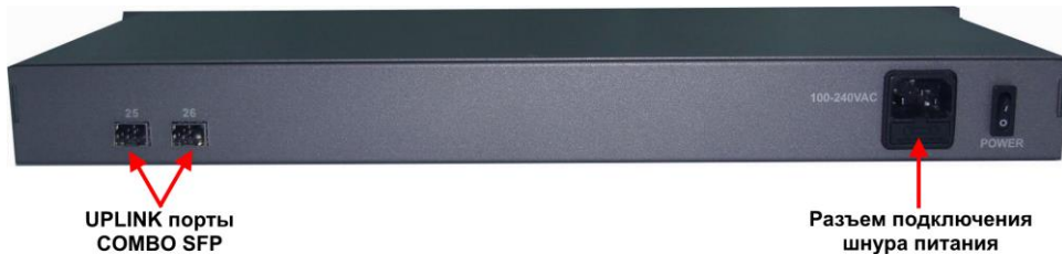
Рис. 3 Коммутатор SW-62422/B (SW-62422/B(400W)), вид сзади