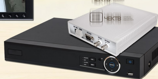
AHD, TVI, CVI СИСТЕМА ВИДЕОНАБЛЮДЕНИЯ ВЫСОКОЙ ЧЁТКОСТИ