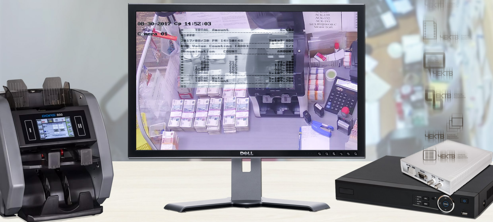
AHD, TVI, CVI система видеонаблюдения высокой чёткости