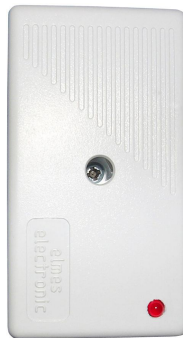
Рисунок 5.2. Радиоретранслятор TRX

Радиоретранслятор TRX служит для увеличения дальности радиоканала между радиокнопками и радиоприёмником (рисунок 6.2). В один радиоретранслятор можно записать коды 112 радиокнопок.