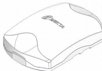
Рисунок 1. Внешний вид прибора

Прибор изготовлен в пластмассовом корпусе (рисунок 1).