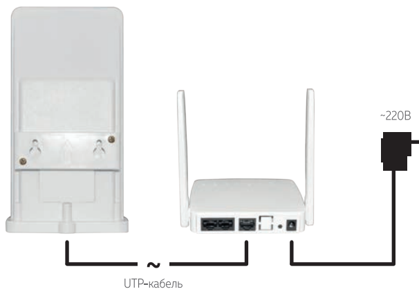
Схема подключения оборудования