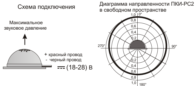
Рис.2 Схема подключения и диаграмма направленности Оповещателя ПКИ-РС2.

5.2. На рис.2 показана схема подключения и диаграмма направленности звука оповещателя ПКИ-РС2.