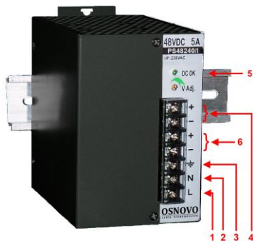
Рис. 2. Блок питания PS-48150/I, PS-48240/I