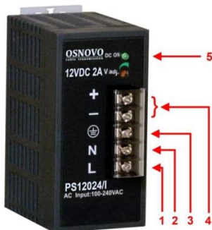
Рис. 1. Блок питания PS-12024/I, PS-48048/I