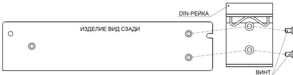
Рисунок 2 – крепление DIN-рейки.