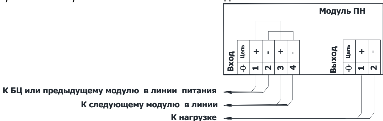
Рисунок 2 Схема подключения модуля

3.4 Неиспользуемый кабельный ввод в корпус оконечного блока следует заглушить. Затянуть гайки всех кабельных вводов.