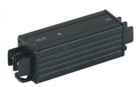
Рис.1 Внешний вид РС1А