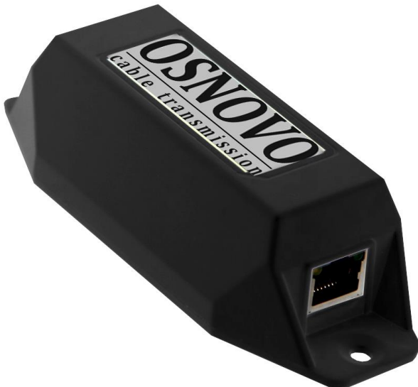
Рис.1 Удлинители E-PoE/1, E-PoE/1G, внешний вид